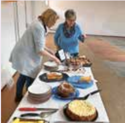
Museum Bickel, Walenstadt